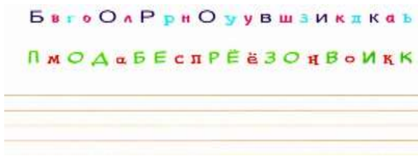
Рис. 4 Практикум