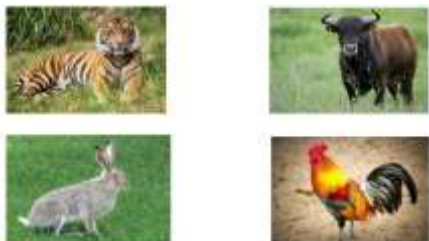
Рис.2 Весёлые семейки

Задание: назови семью животного, начиная с папы (например: слон, слониха, слонёнок) (см. РЛ)