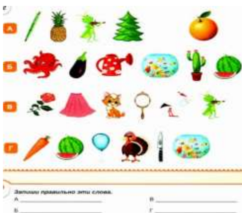
Рис.5 Слова в картинках

Цель: активизация мыслительной деятельности, закрепление навыков звукового анализа слова, закрепление навыка чтения, зрительного образа буквы, развитие внимания, памяти, логического мышления.