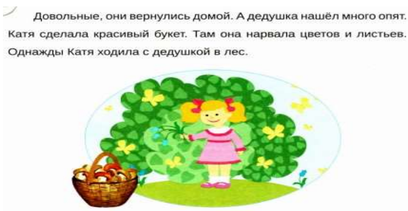
Рис. 6 Предложения в обратном порядке

Цель: закрепление навыка чтения, развитие произвольного внимания, самоконтроля, мыслительных операций.